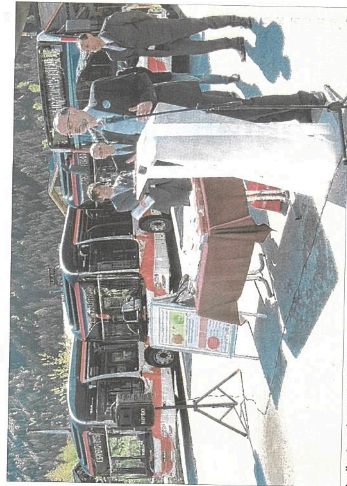
Le directeur régional de Transdev est venu hier présenter les six nouveaux bus hybrides.

Les six bus à motorisation hybride et de grande capacité relient à présent les quatre communes de la vallée. Le choix de ce type de bus s'explique par le besoin de disposer de véhicules suffisamment puissants compte tenu du fort dénivelé de parcours, ce qui